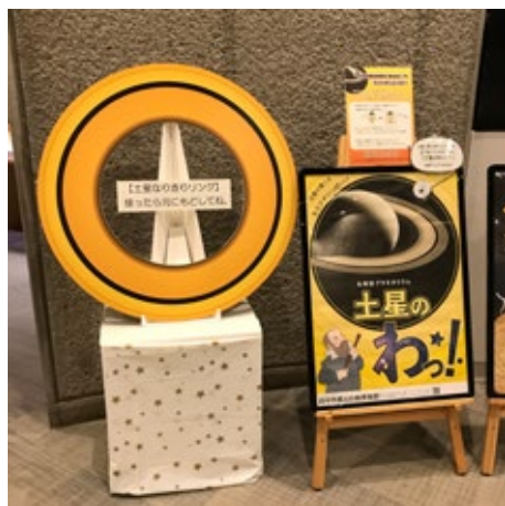
「土星のわっ!」なりきりリング