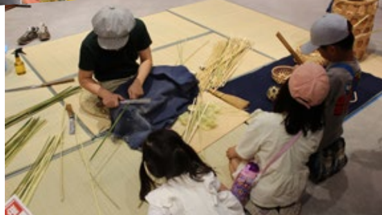
出張! 博物館体験「竹細工」