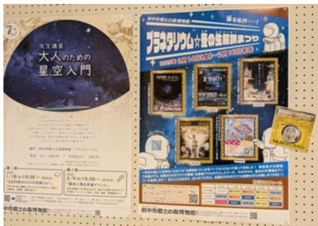
プラネタリウム☆冬の生解説まつり