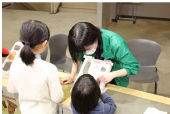
出張! 博物館体験「博物館の資料にさわろう」