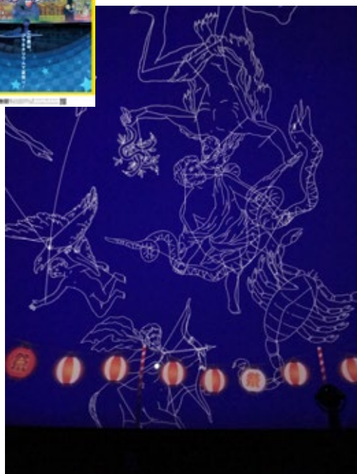
生解説プラネタリウム 「プラネでわっ! 夏まつり」