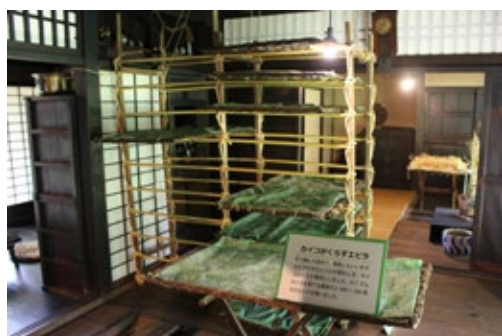
復元建物展示「カイコとくらししたむかしの農家」