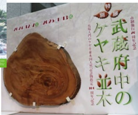
特別展「武蔵府中のケヤキ並木」