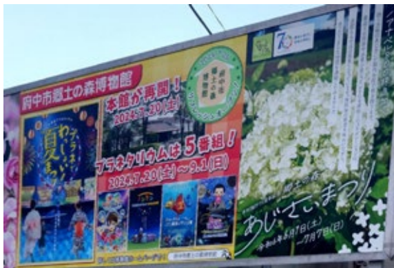
リフレッシュオープン時の告知