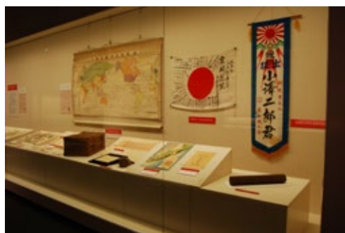
企画展「戦いと争い」