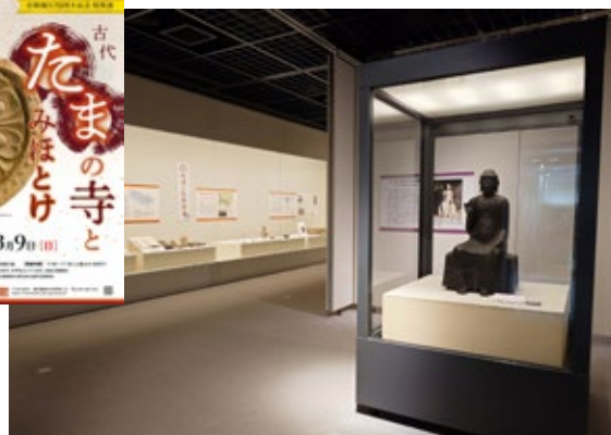
特別展「古代たまとみほとけ」