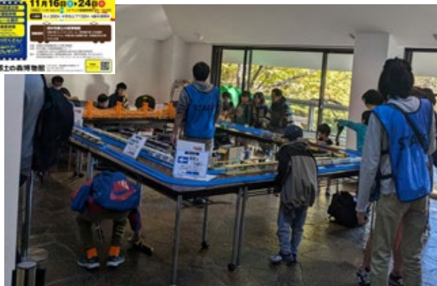
武蔵府中鉄道模型博 2024 「プラレール用のペーパークラフトを作ろう!」