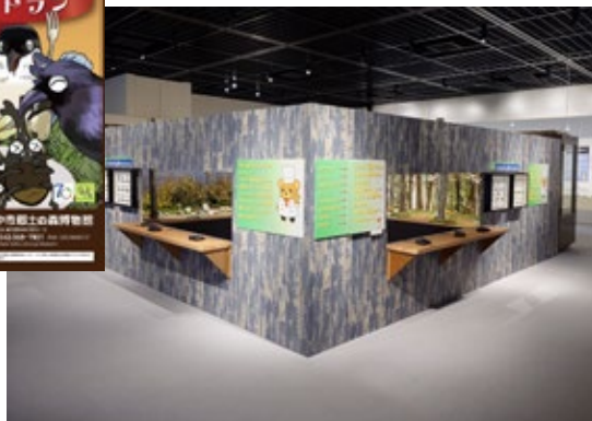
特別展「鳥満員！昆虫レストラン」