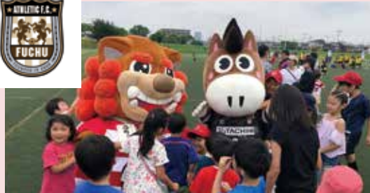
正面向かって右のキャラクターがアスレ君